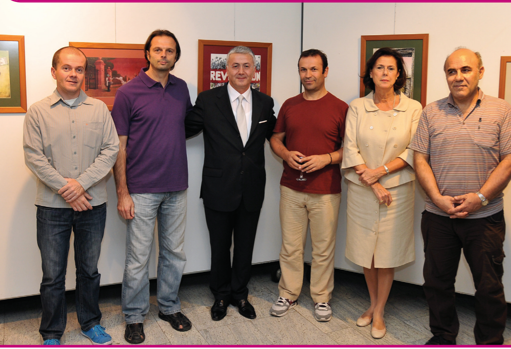
29. Aydın Doğan Karikatur Yarışması'na başvurulan 80 ülkeden 944 sanatçının, 2 bin 945 eserinin arasından dereceye girenler ve sergilenmeye layık görülenler, Kadıköy Belediyesi Caddebostan Kültür Merkezi'nde izleyicilerle buluşuyor.