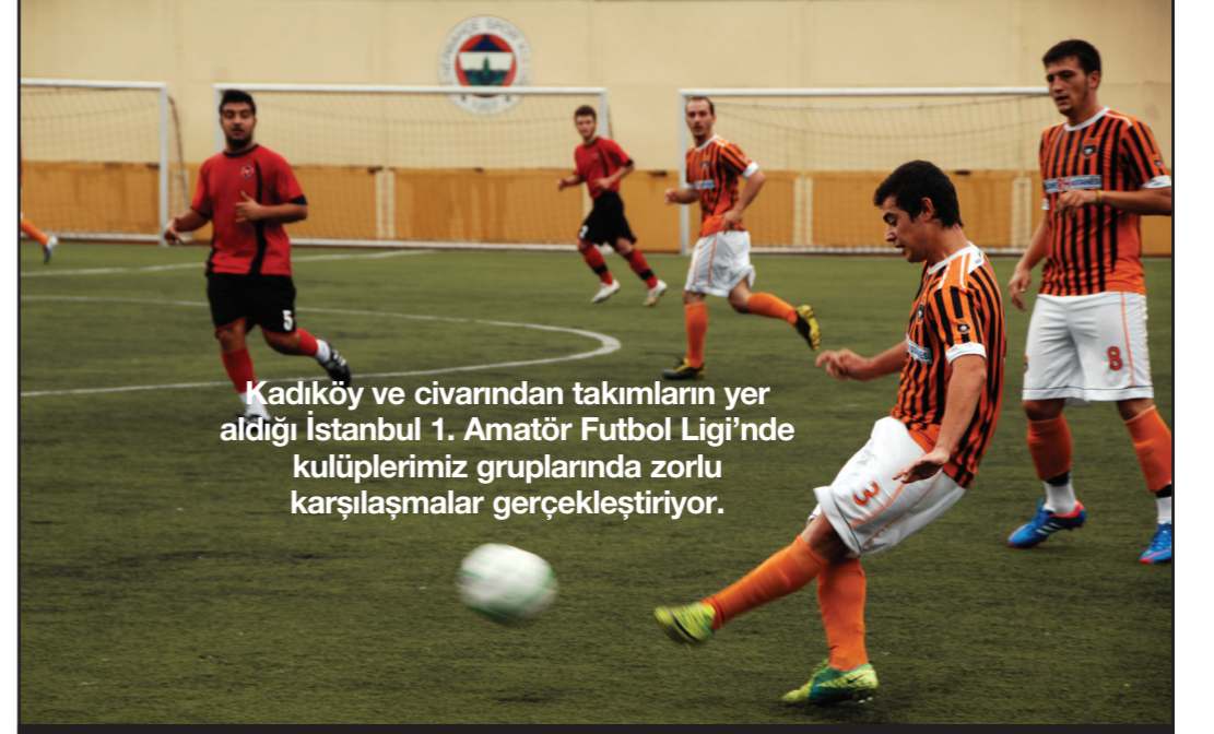
Kadıköy ve civarından takımların yer aldığı İstanbul 1. Amatör Futbol Ligi'nde kulüplerimiz gruplarında zorlu karşılaşmalar gerçekleştiriyor.

Modern Wushu, bugün 1949'dan sonra Çin Halk Cumhuriyeti'nde geliştirilen bir gösteri sporunun adı. Modern Wushu müsabakaları taolu ve sanda (döğüş) olmak üzere iki disiplinden oluşur. Günümüzde 83 ülkede Wushu Federasyonu bulunuyor.